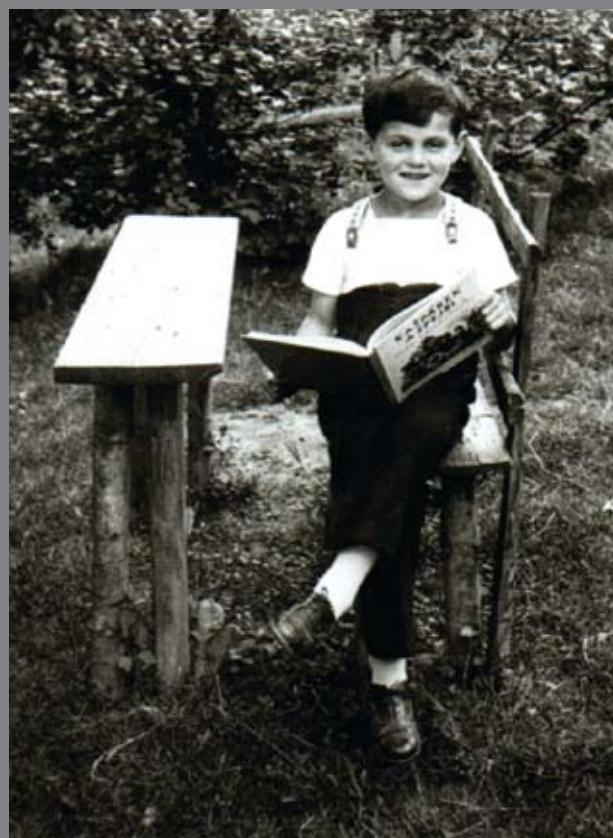
Jan na zahradě