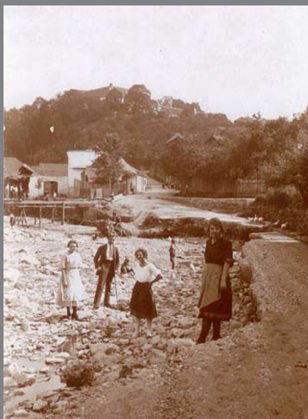
Otto s neznámými ženami v ulici Na Potokách po povodni v roce 1922