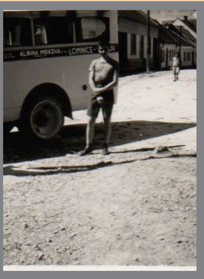
na zastávce autobusů v Lomnici, dnes křižovatka ulic Tišnovské a Dlouhé