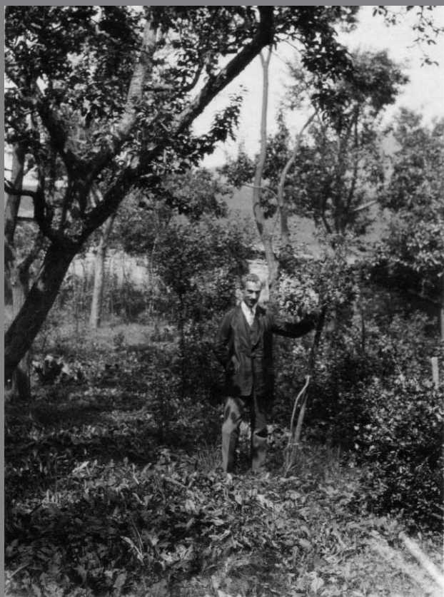
Otto na zahradě svého domu